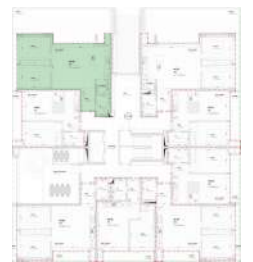
Localização no Piso 0

Planta comercial sem vínculo contratual.