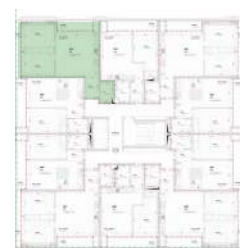
Localização no Piso 8

Planta comercial sem vínculo contratual.