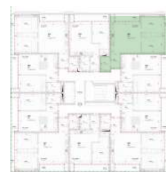
Localização no Piso 8

Planta comercial sem vínculo contratual.