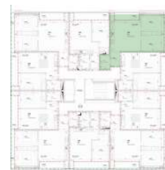
Localização no Piso 7

Planta comercial sem vínculo contratual.