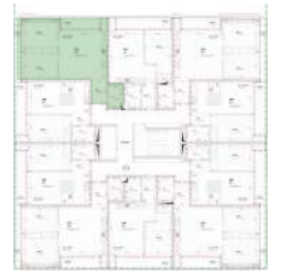
Localização no Piso 5

Planta comercial sem vínculo contratual.