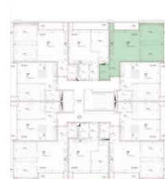
Localização no Piso 5

Planta comercial sem vínculo contratual.