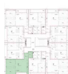
Localização no Piso 3

Planta comercial sem vínculo contratual.