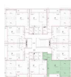
Localização no Piso 3

Planta comercial sem vínculo contratual.