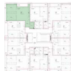
Localização no Piso 2

Planta comercial sem vínculo contratual.