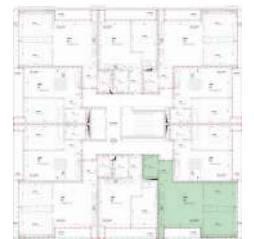
Localização no Piso 2

Planta comercial sem vínculo contratual.