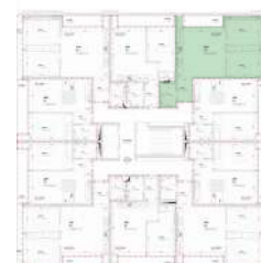
Localização no Piso 2

Planta comercial sem vínculo contratual.