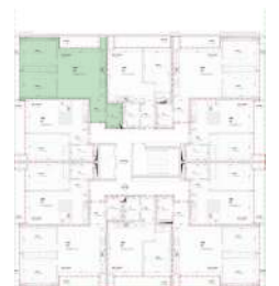
Localização no Piso 1

Planta comercial sem vínculo contratual.