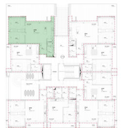
Localização no Piso 0

Planta comercial sem vínculo contratual.