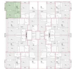
Localização no Piso 10