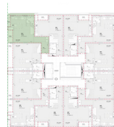
Localização no Piso 9

Planta comercial sem vínculo contratual.