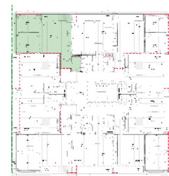
Localização no Piso 7

Planta comercial sem vínculo contratual.