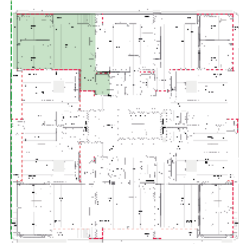
Localização no Piso 5

Planta comercial sem vínculo contratual.