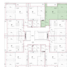
Localização no Piso 5

Planta comercial sem vínculo contratual.