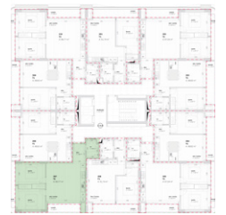
Localização no Piso 2

Planta comercial sem vínculo contratual.