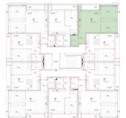
Localização no Piso 2

Planta comercial sem vínculo contratual.